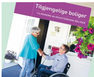
Forsidebilde på heftet «Tilgjengelige boliger»

Her kan du lese mer om rapporten og FFO`s anbefalinger.