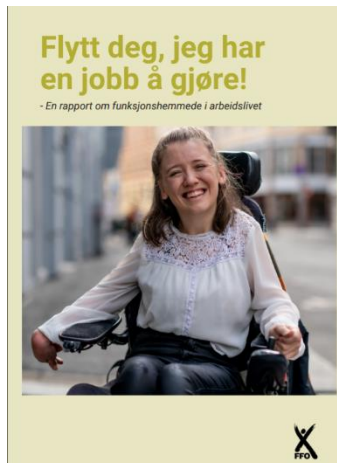
Ill: Forsiden på rapporten