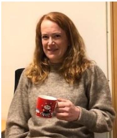
Nina med kaffekoppen

Her kan du lese om prosjektet, hovedkonklusjoner og selve rapporten.